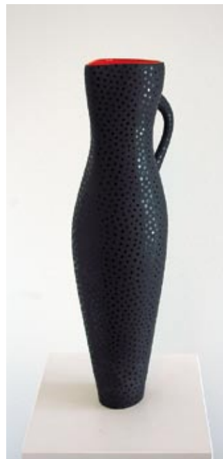
Sølvi Hurlen, Mugge