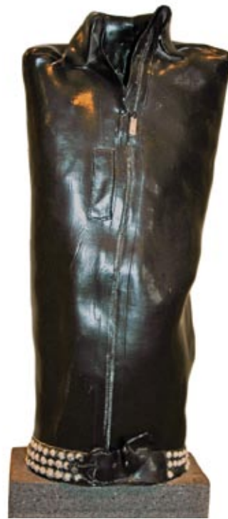
Haico Nitzsche, Vest