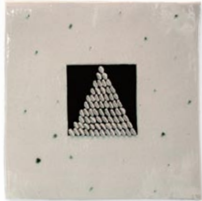
Gro Skåltveit, Fat