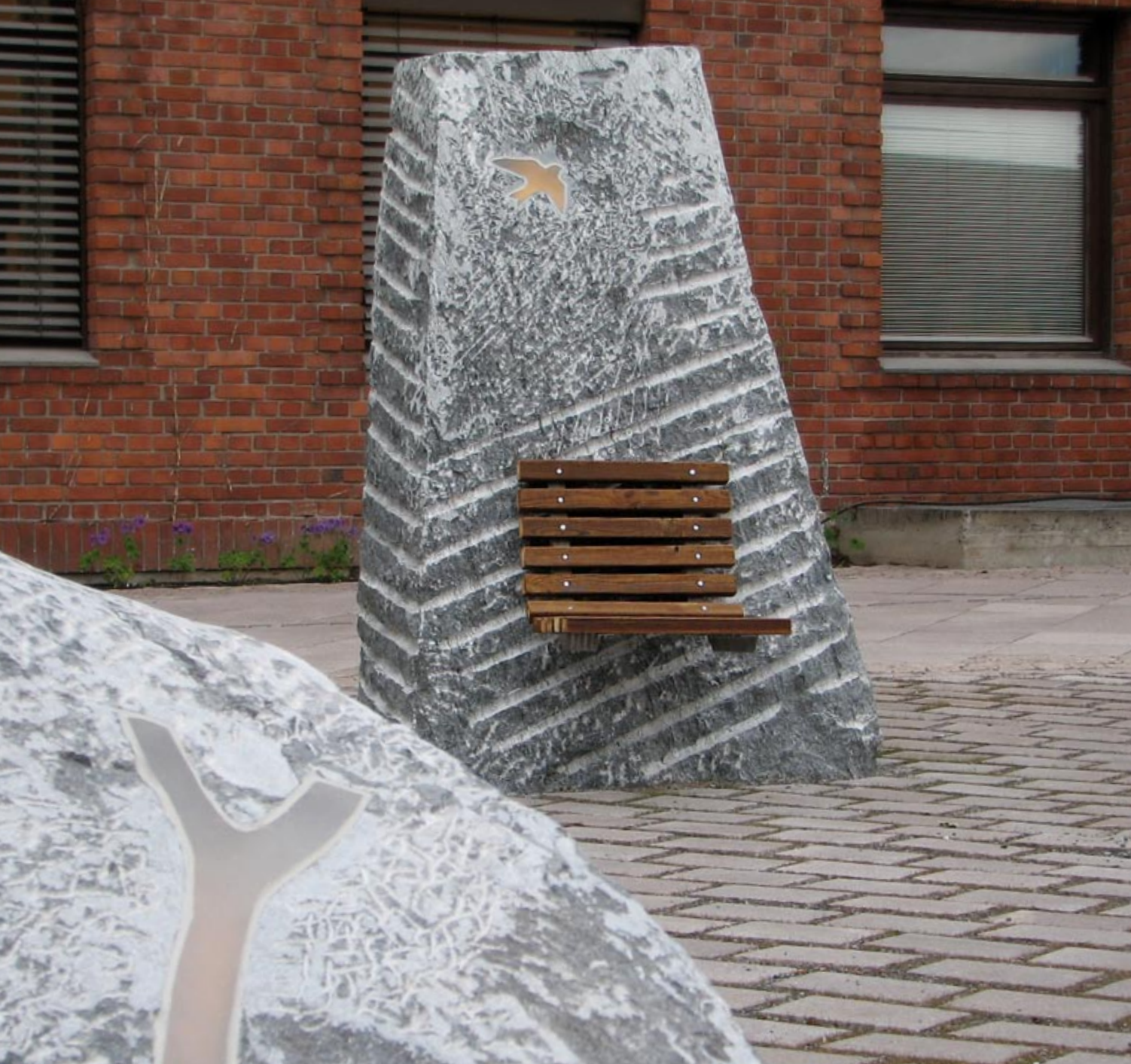
Philipp Dommen, Drømmer . Detalj av skulpturgruppe ved inngangspartiet

Psykiatribygget i Porsgrunn består av Distriktpsikiatrisk Senter Porsgrunn (DPS), med ulike psykiatriske dagtilbud og to sengeposter for voksne, samt et poliklinisk dagtilbud for barn og ungdom (BUP). Bygget ble påbegynt høsten 2006 og i desember 2007 flyttet de ulike funksjonene inn.