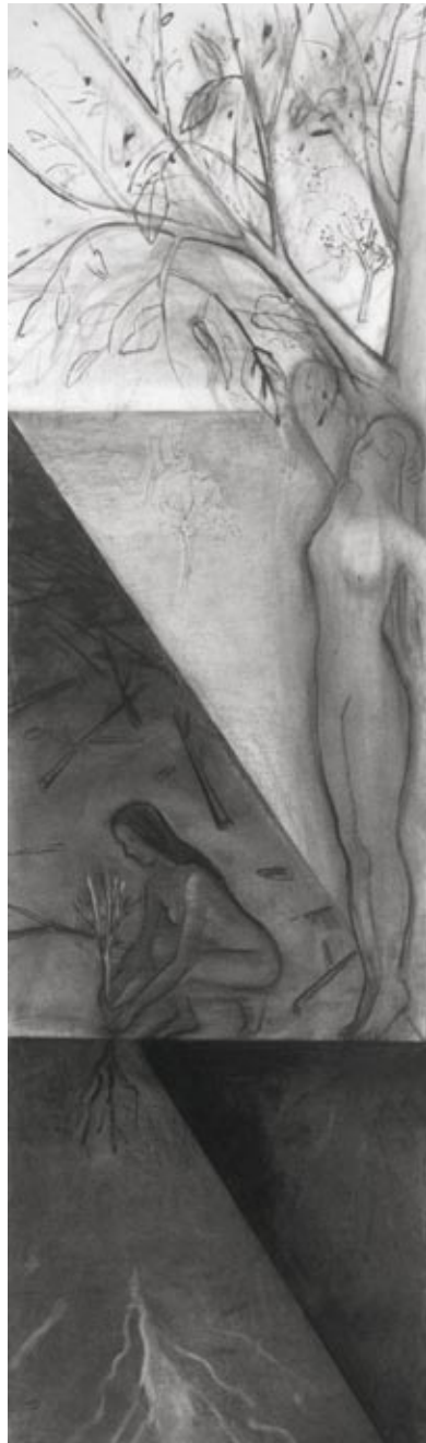
Torhild Grøstad, Draumen om treet