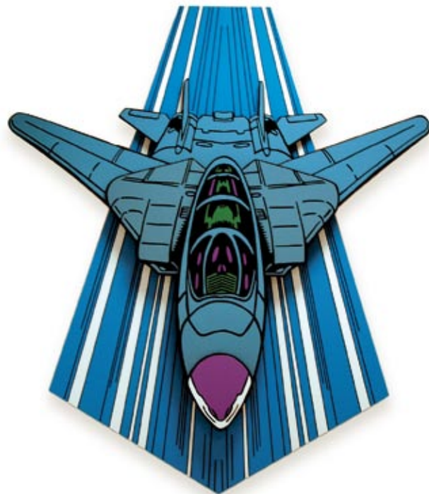
Eivind Blaker, Uten tittel