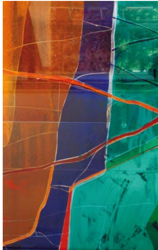
Kjell Nupen, Skogslys , detalj