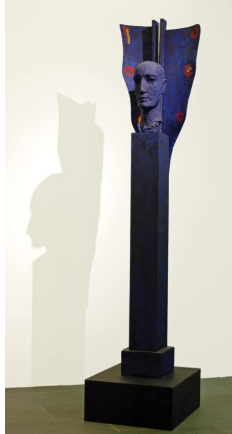
Boge Berg, Fra en verden langt borte

Kjell Pahr-Iversen Ikon maleri Boge Berg Fra en verden langt borte treskulptur