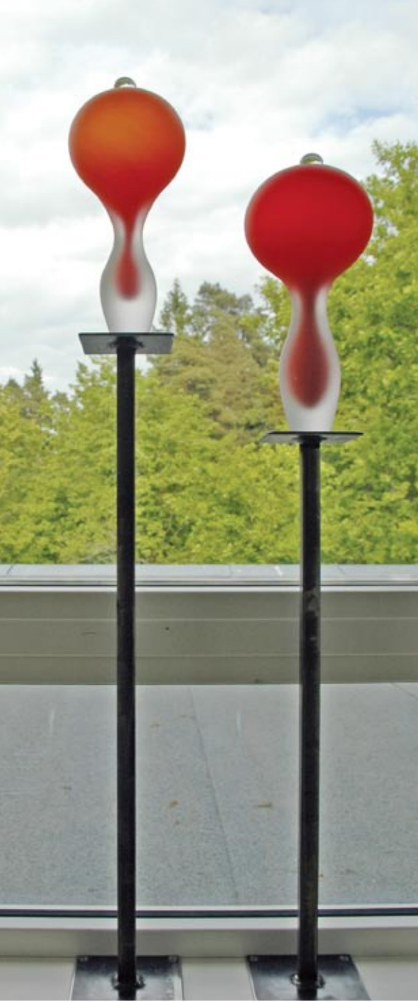
Tuva Gonsholt, Uten tittel