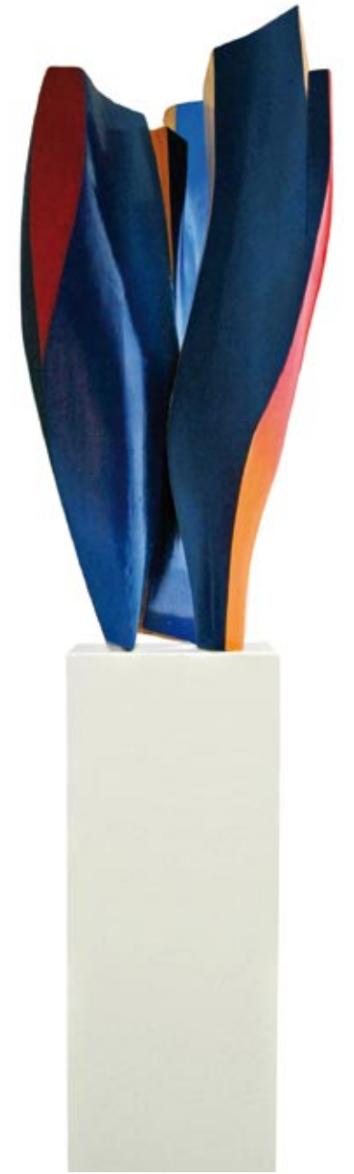
Pål Engedahl, Flamme