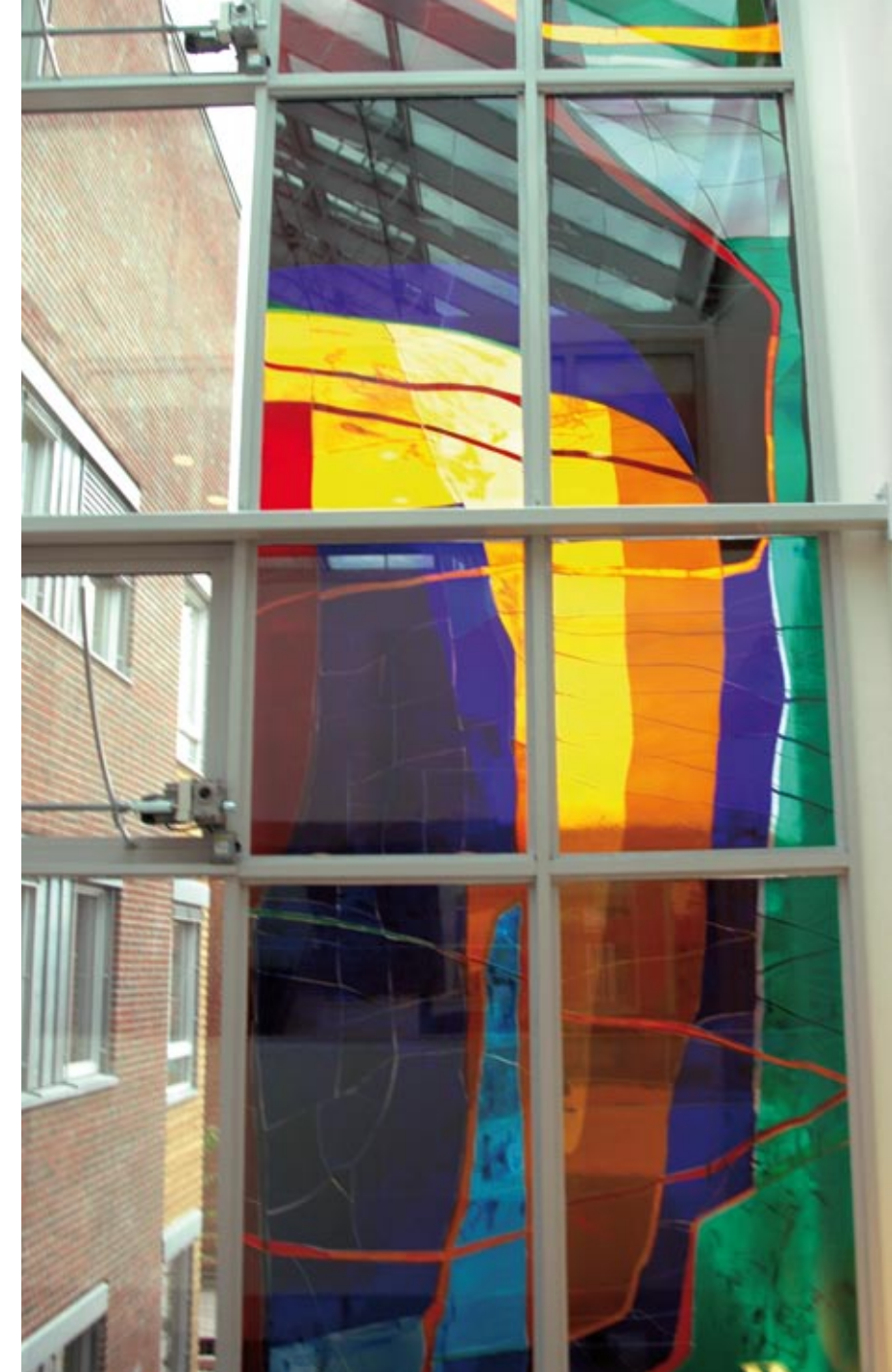
Kjell Nupen, Skogslys , sett innenfra

Samtidig binder fragmentene helheten sammen når arbeidet leses fra utsiden, og lager en tydeligere "landskapsbevegelse". Fornemmelsen av skogslys, vann, løvverk og andre deler av naturens linjer trer frem.