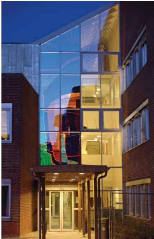
Kjell Nupen, Skogslys , sett utenfra