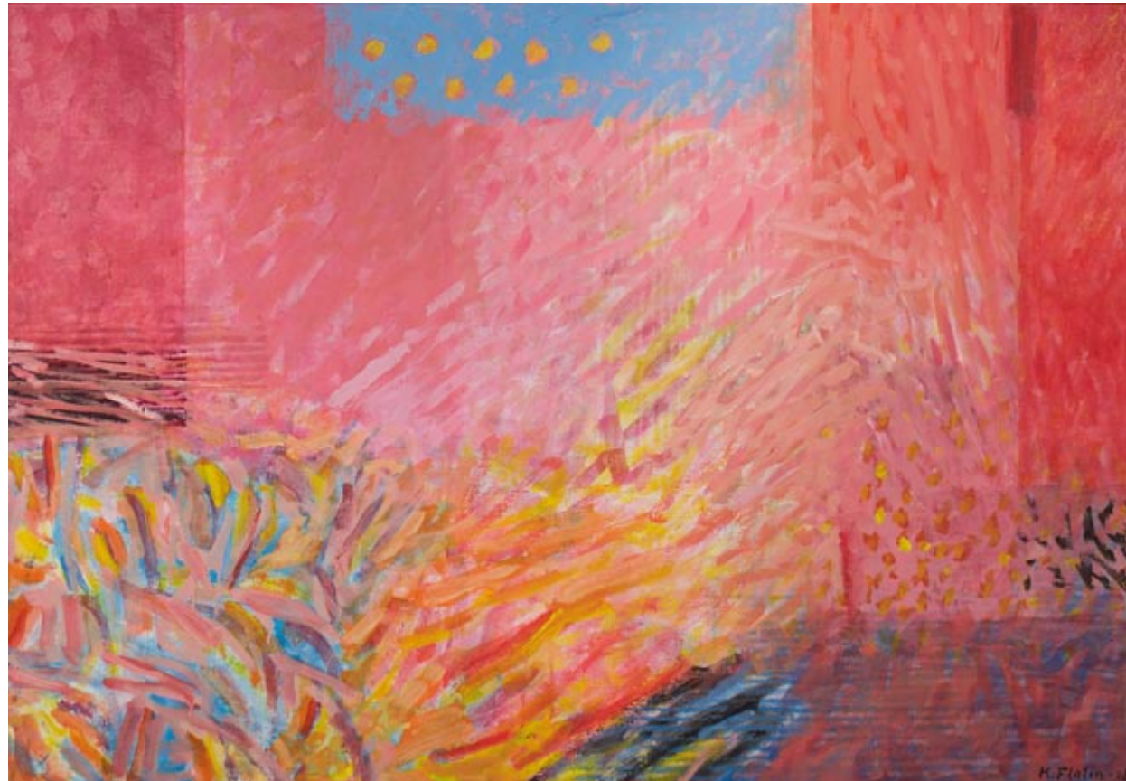
Knut Flatin, Soldans