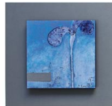
Trine Lindheim, Uten tittel I-III